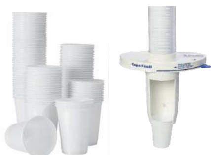
Dispenser Acrílico para copos fácil Copos descartáveis para água Copos descartáveis para café

A linha de acessórios possui os mais variados produtos de apoio a limpeza e conservação de ambientes.