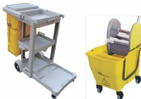
Lixeira Coleta Seletiva Container plástico Suportes de lixeiras Carro Funcional Balde espremedor