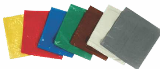
Sacos para Lixo - Cores Sacos para Lixo - Infectante Sacos para Lixo - Transparente