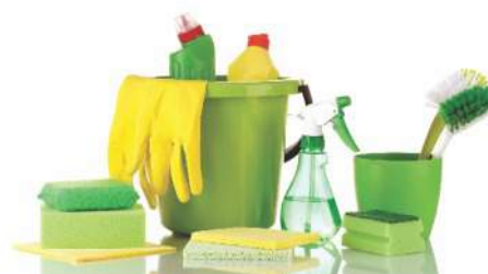
Baldes Plásticos, Espanadores Flanelas para Limpeza em geral Panos Multi-uso