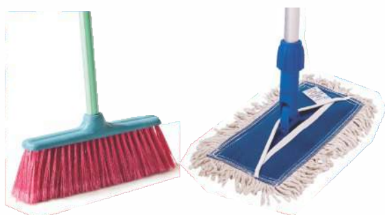
Mops Líquido e pó Vassouras Sintéticas, Piaçava Escovas para limpeza geral Rodos de Alumínio e Plástico