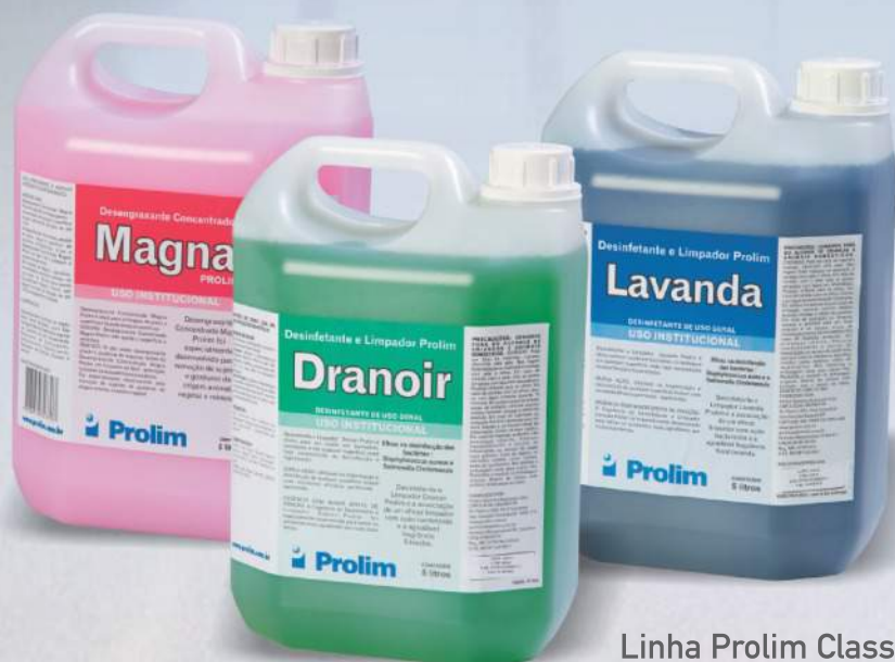
Linha Prolim Classic