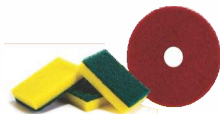
Discos de Limpeza, Remoção e Polimento Espanjas e Fibras de Limpeza Luvas de proteção - cores e tamanhos